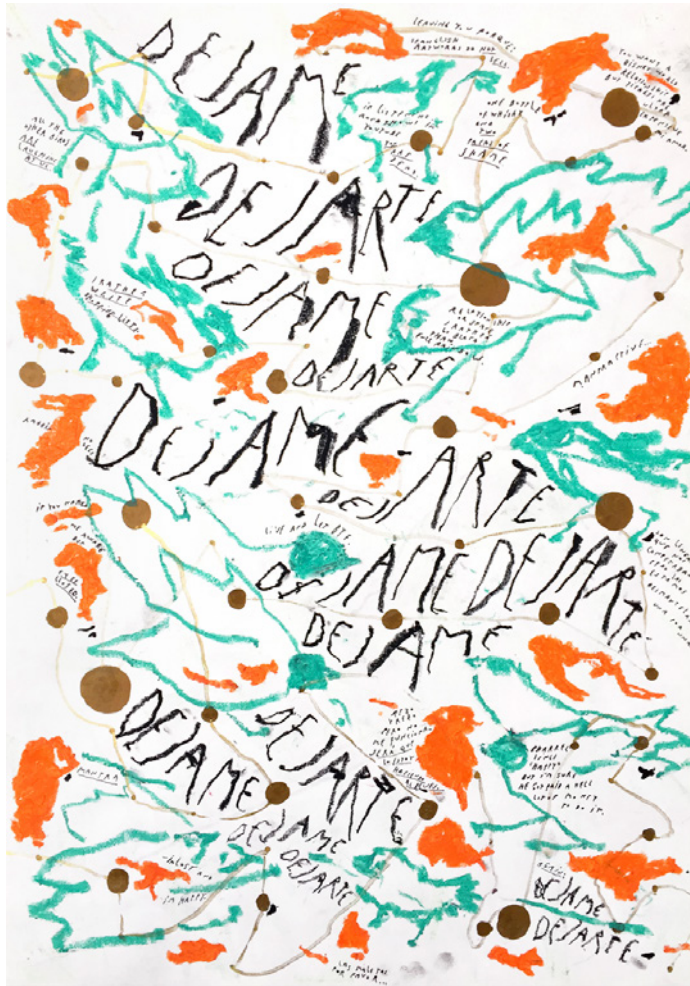
6_Redes Zoociales (Serie de 3 obras) Acrílico, pasteles al óleo, crayón industrial y tinta sobre papel Fabriano 42 x 59,4 cm. 2020