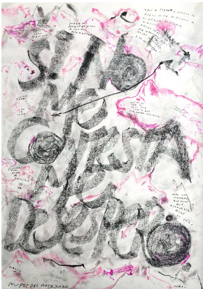
9_ Si no me contesta me desespero Acrílico, pasteles al óleo, crayón industrial y tinta china sobre papel Fabriano 42 x 59,4 cm. 2020