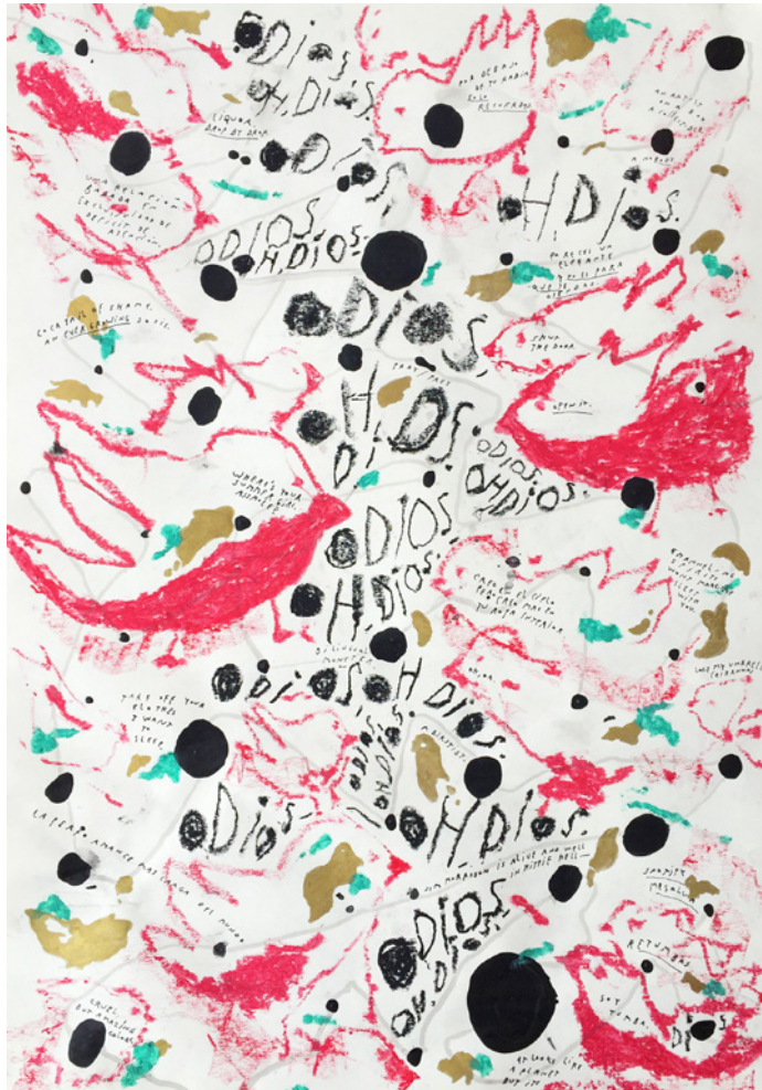
8_Redres Zoociales (Serie de 3 obras) Acrílico, pasteles al óleo, crayón industrial y tinta sobre papel Fabriano 42 x 59,4 cm. 2020