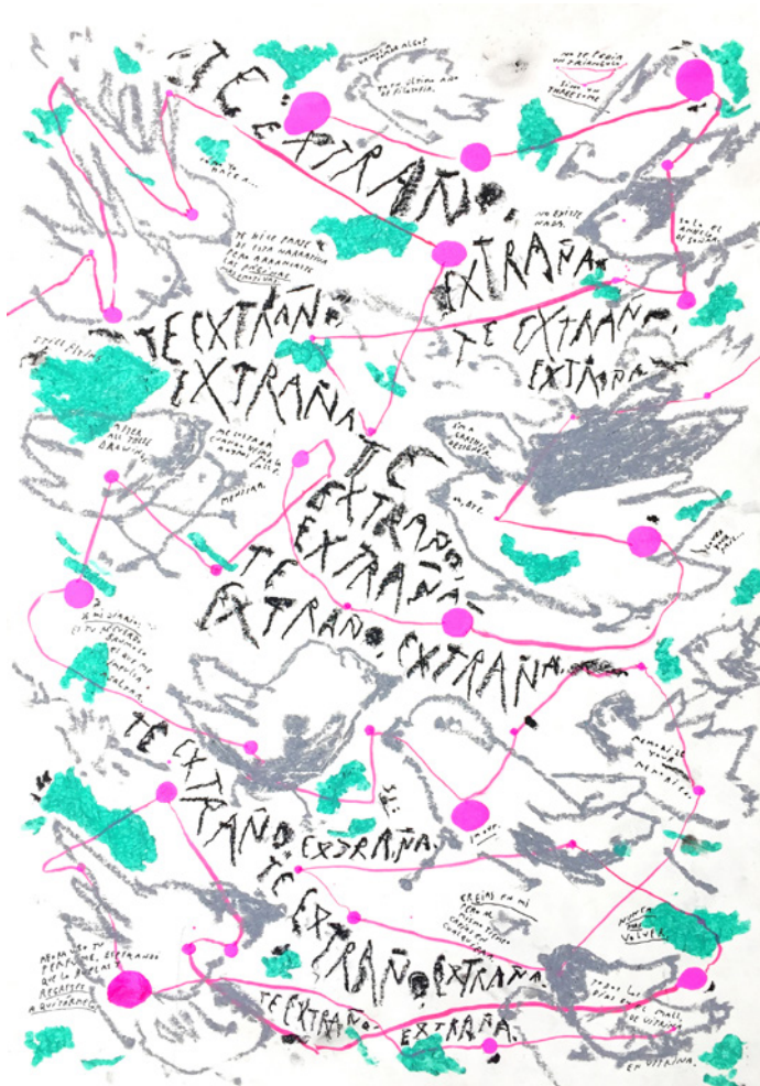
7_ Redes Zooicales (Serie de 3 obras) Acrílico, pasteles al óleo, crayón industrial y tinta sobre papel Fabriano 42 x 59,4 cm. 2020