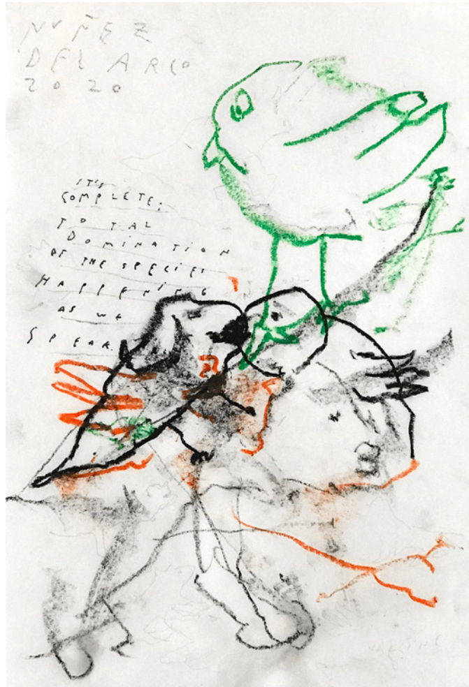
*1_Total Domination Pasteles al óleo, crayón industrial y tinta sobre papel sketch 21 x 29,7 cm. 2020