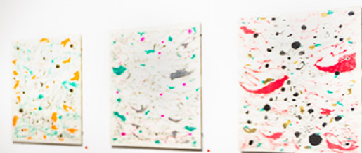
En esta imagen izquierda *5_Banderas / Flags Serie de 4 banderas Pasteles al óleo Sennelier sobre tela 2 x 1,4 m. 2020