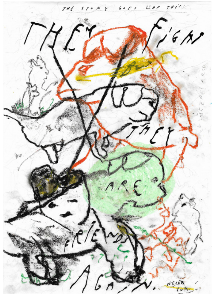
2_They Fight Pasteles al óleo, crayón industrial y tinta sobre papel sketch 21 x 29,7 cm. 2020