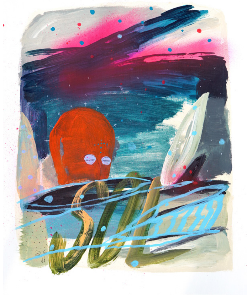
*Sol De la serie D3J4VU Técnica mixta sobre papel de lienzo 40 x 50 cm. 2021