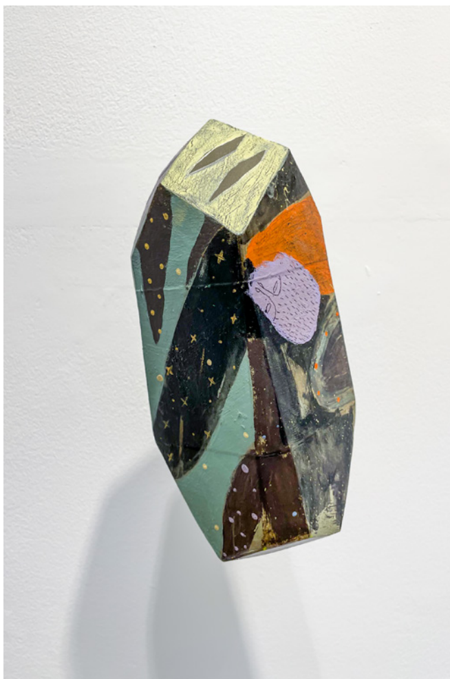
*F@RM45 (5) Acrílico sobre objeto de madera Medidas variables 2021