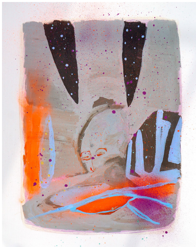
*Luz De la serie D3J4VU Técnica mixta sobre papel de lienzo 40 x 50 cm. 2021