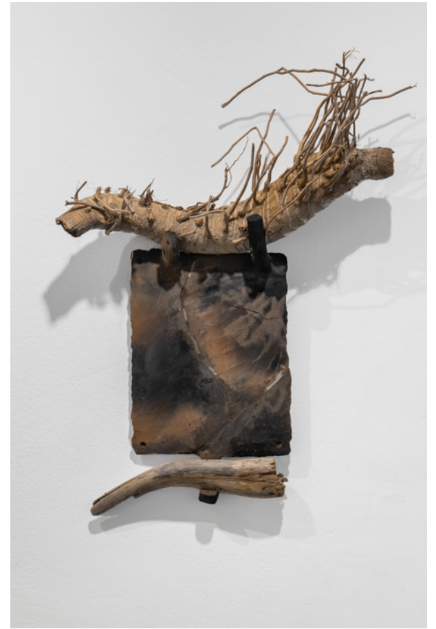
*313M3N7©5 Tríptico, técnica mixta, objetos en cerámica Medidas variables 2021