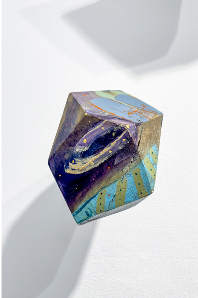
*F@RM45 (7) Acrílico sobre objeto de madera Medidas variables 2021