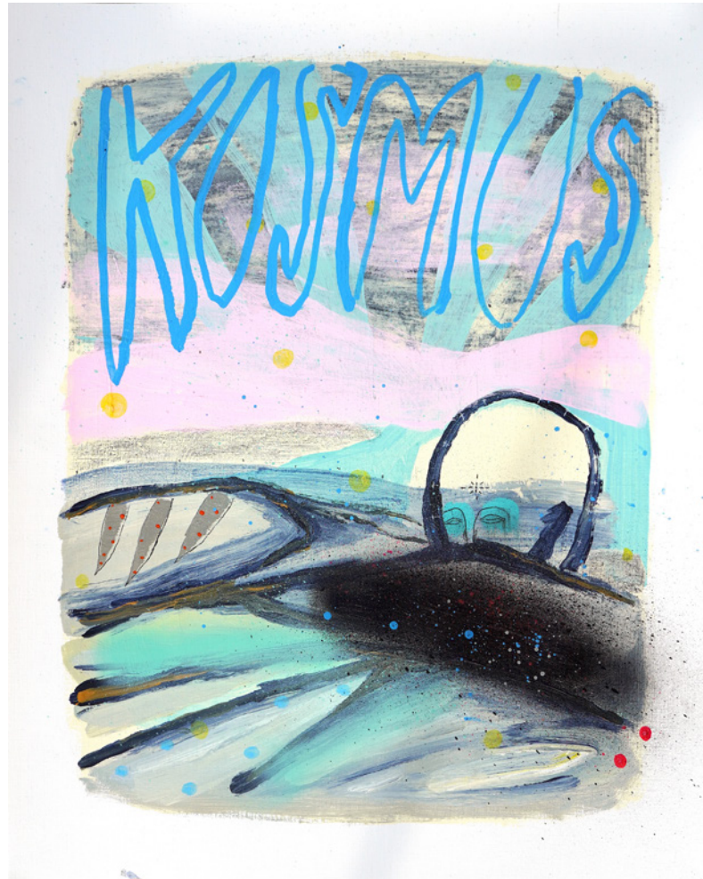
*Kosmos De la serie D3J4VU Técnica mixta sobre papel de lienzo 40 x 50 cm. 2021