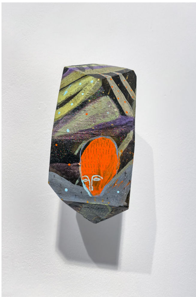
*F@RM45 (2) Acrílico sobre objeto de madera Medidas variables 2021