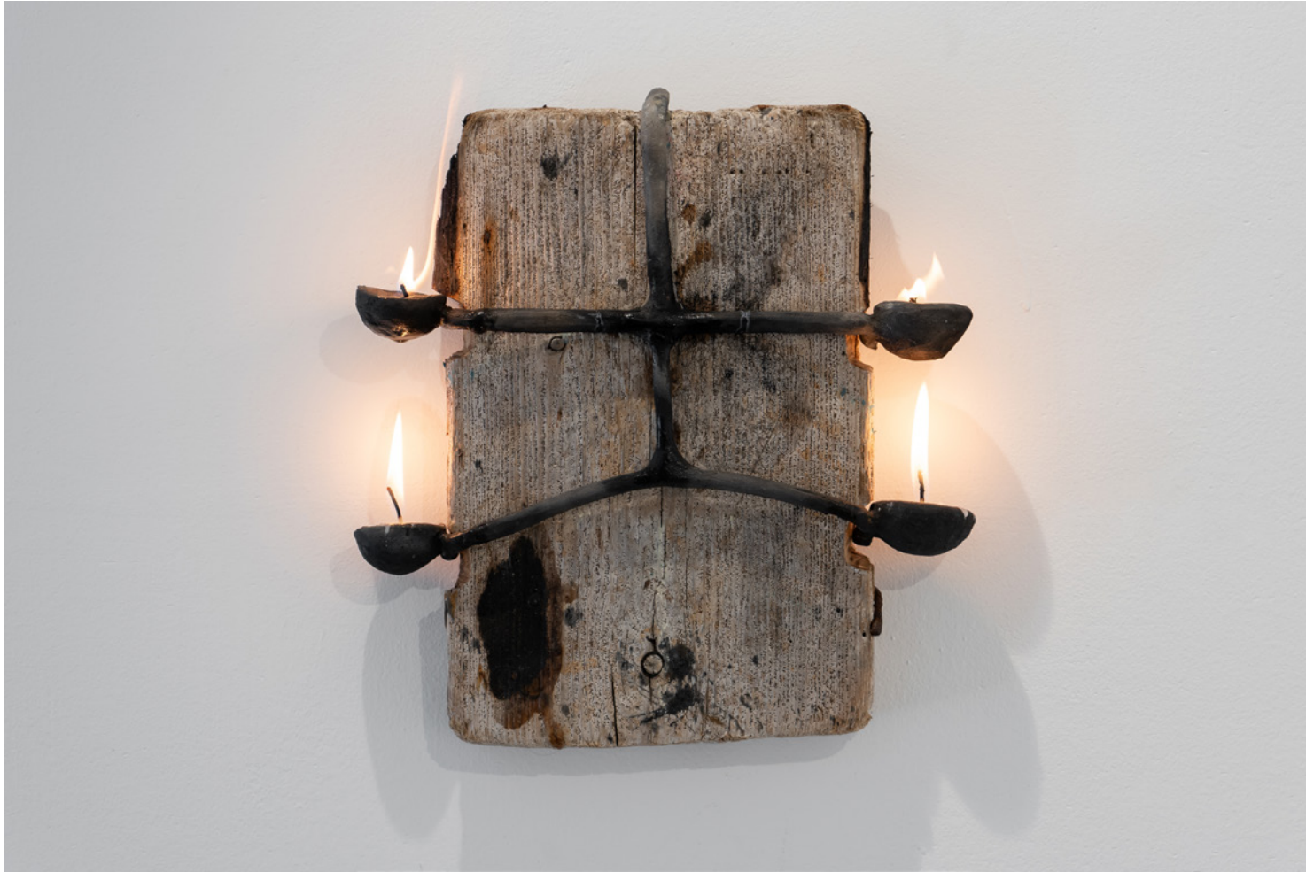
*P3N74GR4M4 Objeto de madera y cerámica con vela Medidas variables 2021