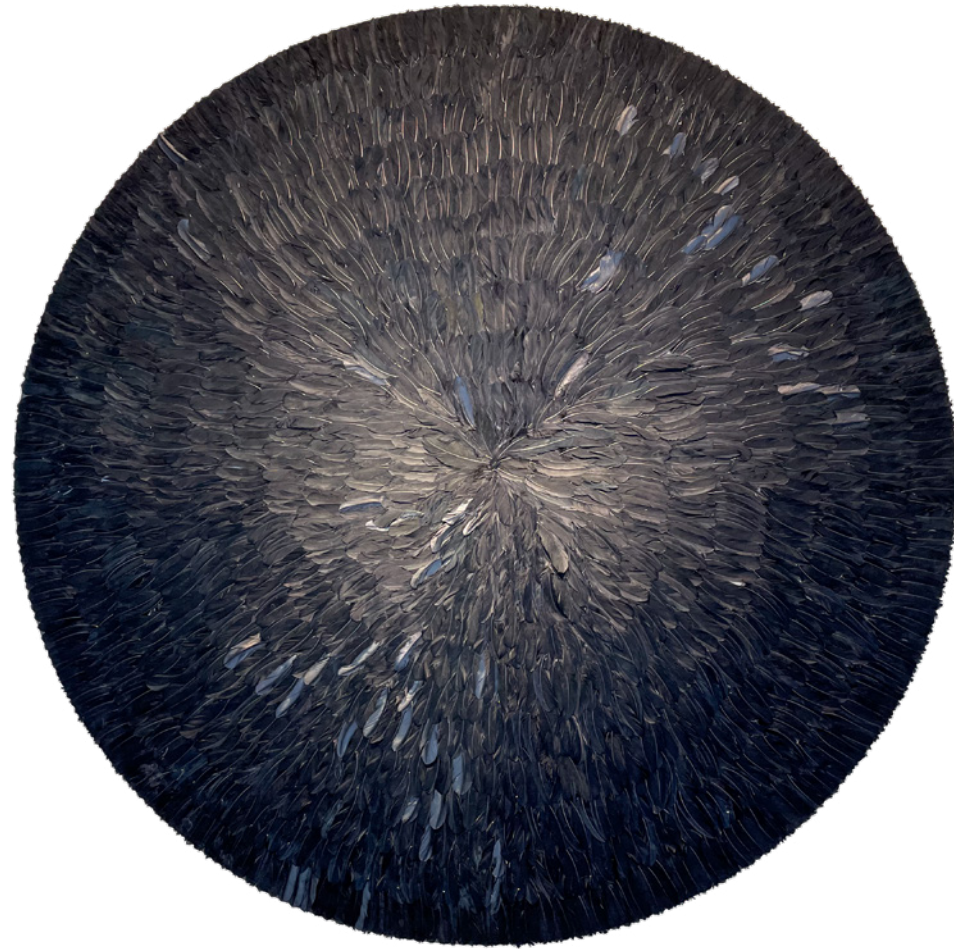
*4N1M4I V1D3N73 Círculo de plumas de ave Diámetro 180 cm. 2021