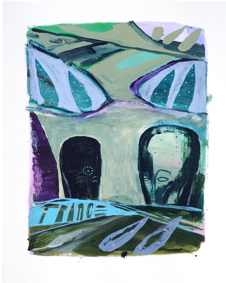
*Trance De la serie D3J4VU Técnica mixta sobre papel de lienzo 40 x 50 cm. 2021