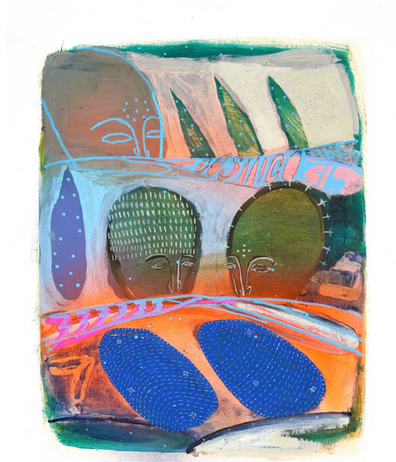
*CÓSMICO De la serie D3J4VU Técnica mixta sobre papel de lienzo 40 x 50 cm. 2021