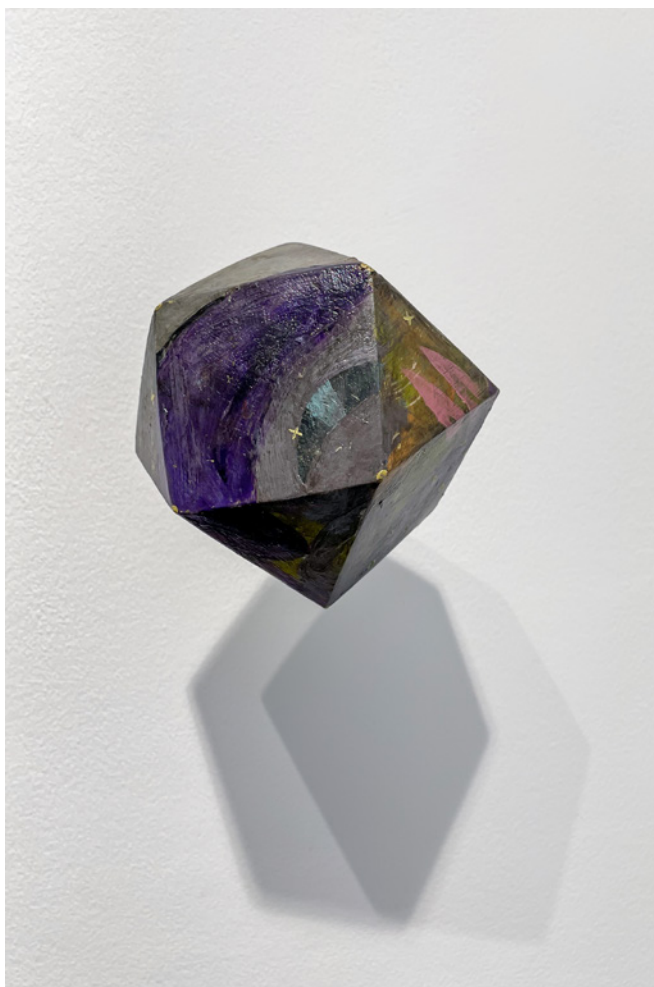
*F@RM45 (3) Acrílico sobre objeto de madera Medidas variables 2021