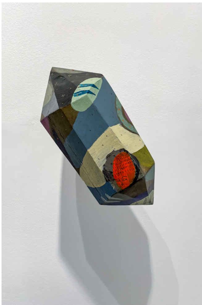
*F@RM45 (4) Acrílico sobre objeto de madera Medidas variables 2021