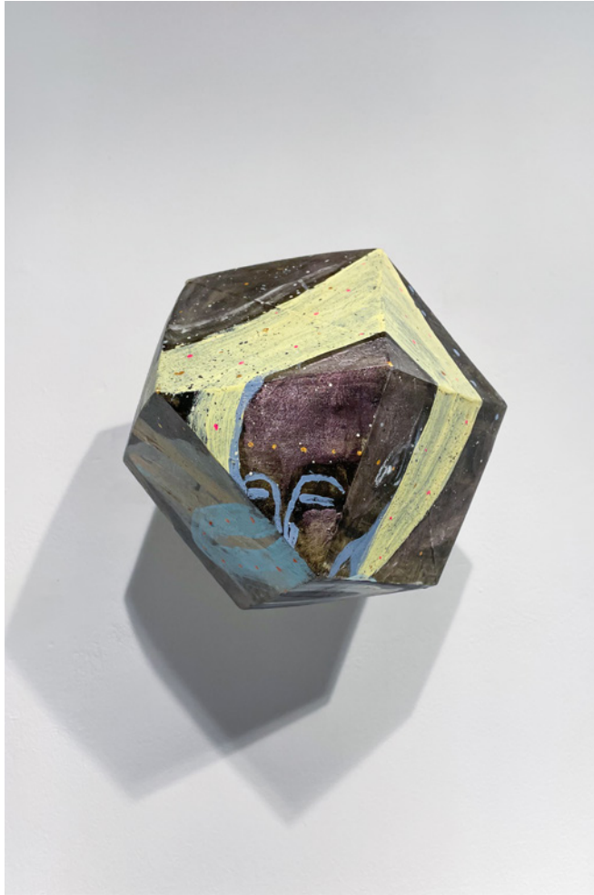
*F@RM45 (1) Acrílico sobre objeto de madera Medidas variables 2021