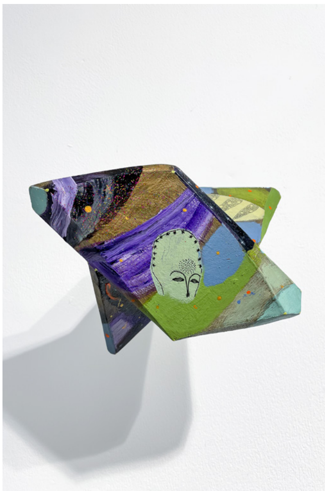
*F@RM45 (8) Acrílico sobre objeto de madera Medidas variables 2021