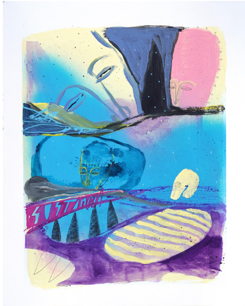
*Sustancia De la serie D3J4VU Técnica mixta sobre papel de lienzo 40 x 50 cm. 2021