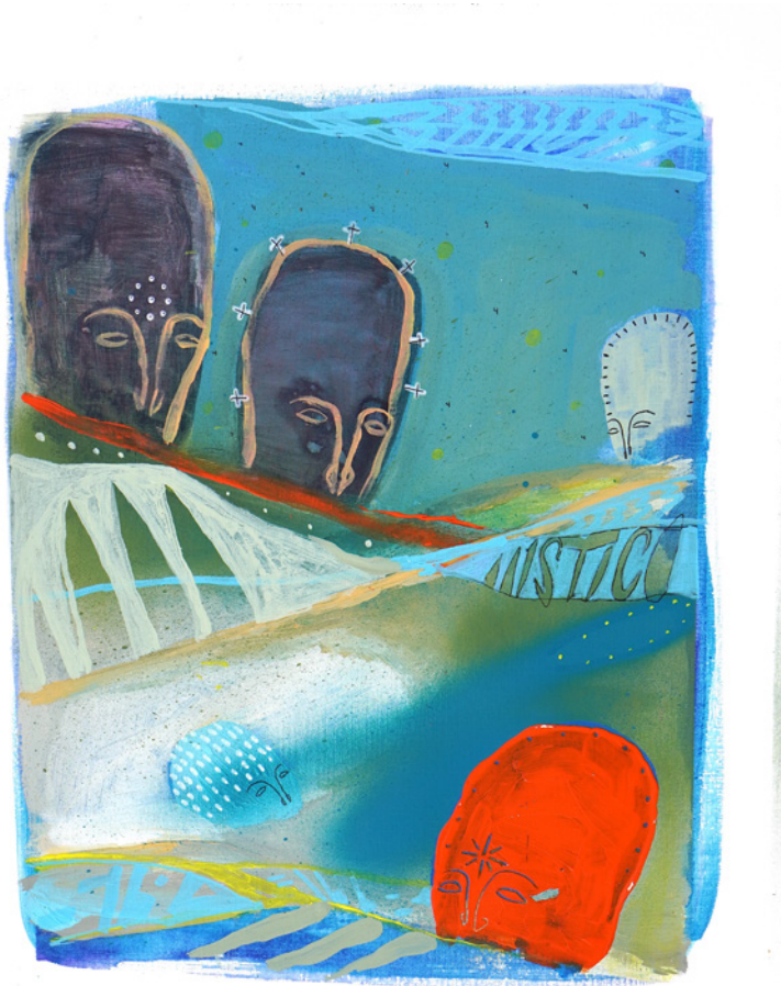
*Místico De la serie D3J4VU Técnica mixta sobre papel de lienzo 40 x 50 cm. 2021