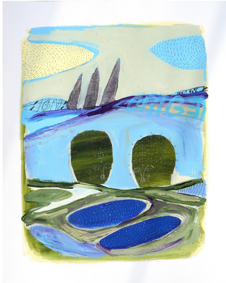
*Origen De la serie D3J4VU Técnica mixta sobre papel de lienzo 40 x 50 cm. 2021