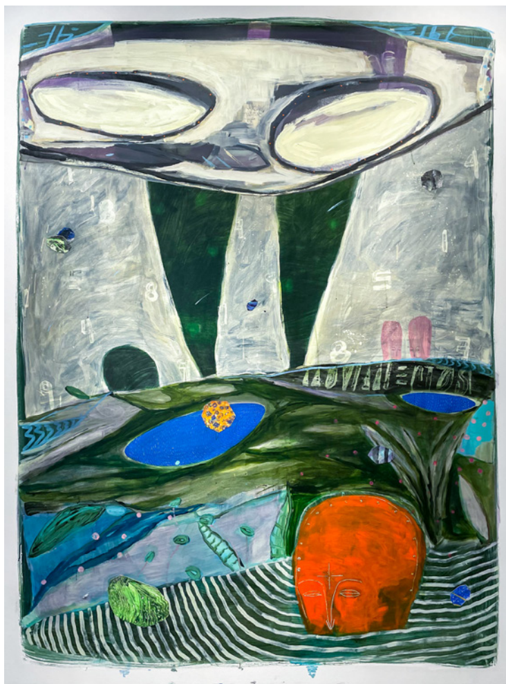
*R4P7© De la serie D3J4VU Técnica mixta sobre lienzo 200 x 150 cm. 2021