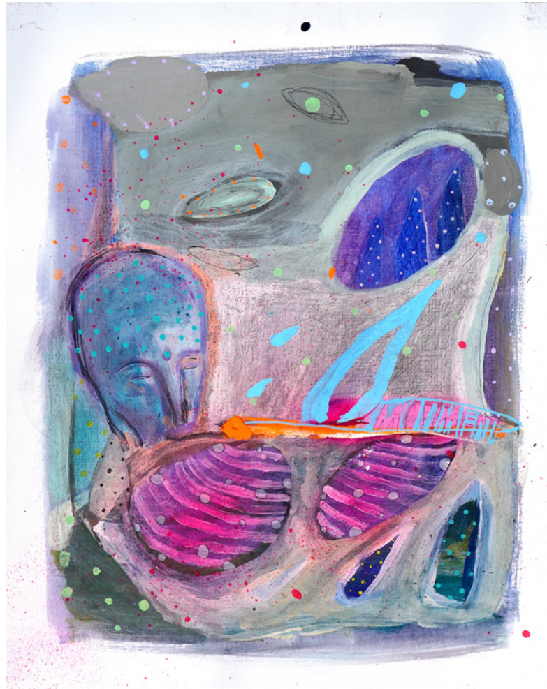
*Espejo De la serie D3J4VU Técnica mixta sobre papel de lienzo 40 x 50 cm. 2021