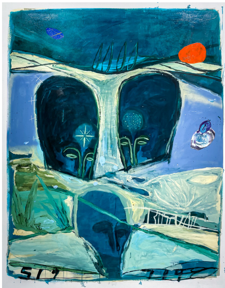
*3NT35 Técnica mixta sobre lienzo 150 x 120 cm. 2021