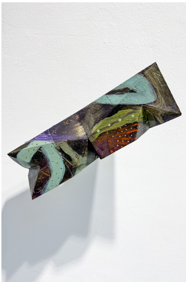
*F@RM45 (6) Acrílico sobre objeto de madera Medidas variables 2021