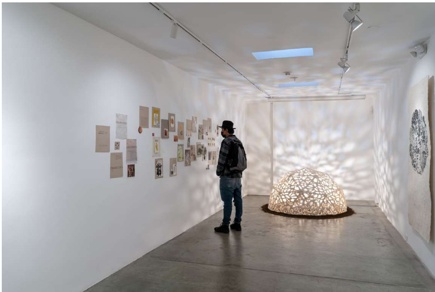
Biocenosis Técnica mixta 100 x 180 cm. 2020