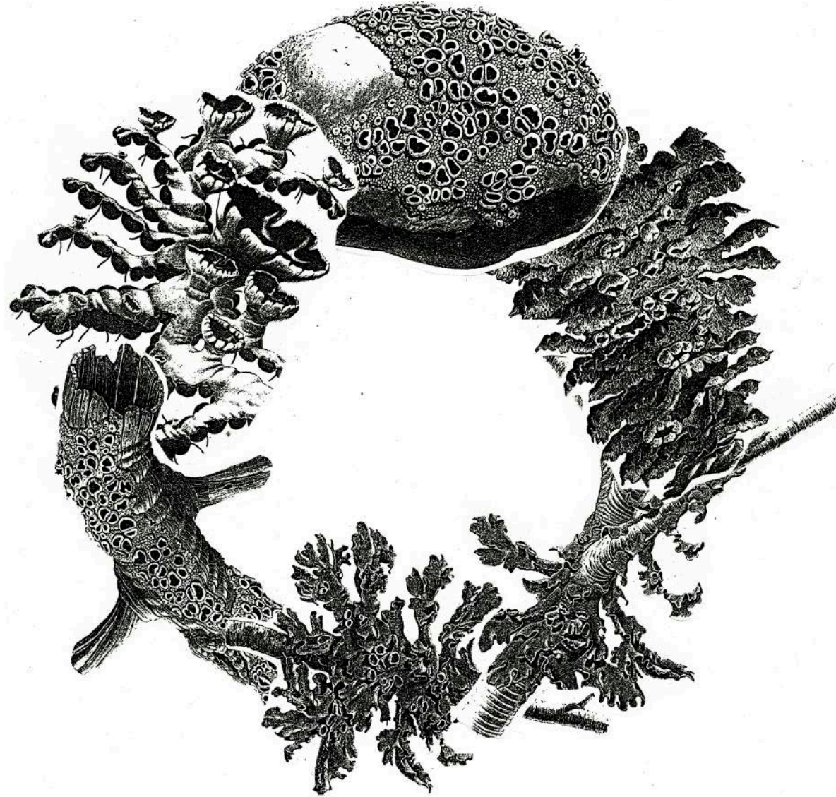
*Holobiontes Collage 21.5 x 28 cm. 2020