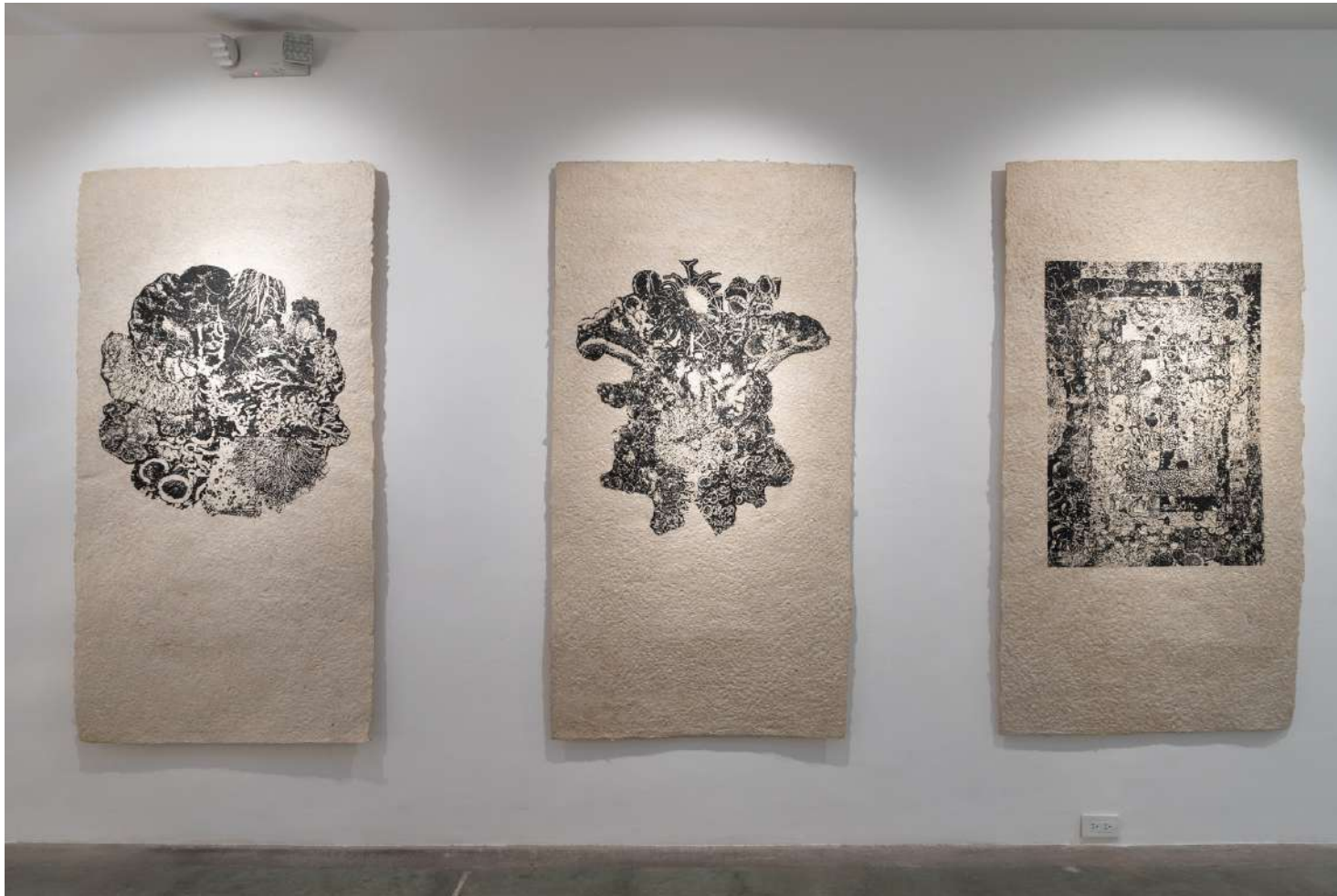
*Serie Holobiontes Serigrafía sobre papel orgánico 100 x 190 cm. Edición 4 2021