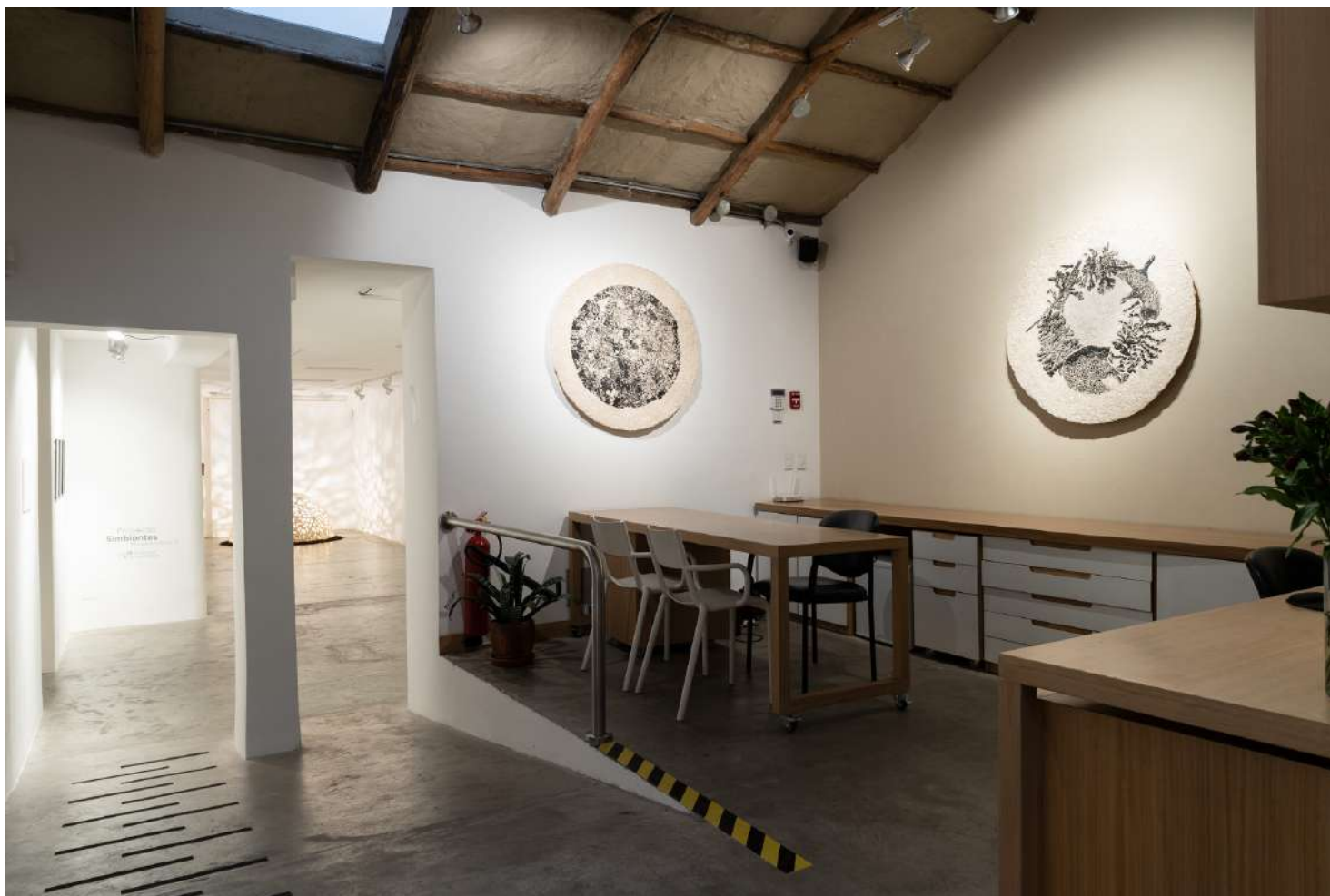
*Serie Holobiontes Serigrafía sobre papel orgánico 104.5 x 104.5 cm. Edición 4 2021