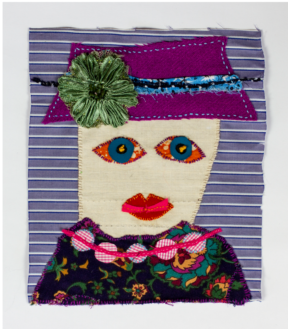
3. Personaje #1 Telas, hilos Dimensiones variables 2022 - 2023