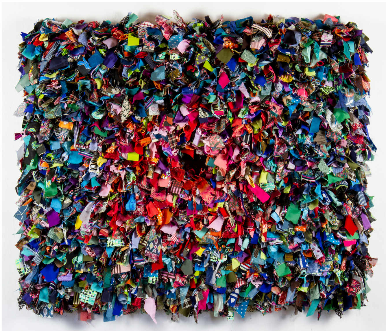
5. Secretos Telas, hilos, caja 180 x 126 cm 2019