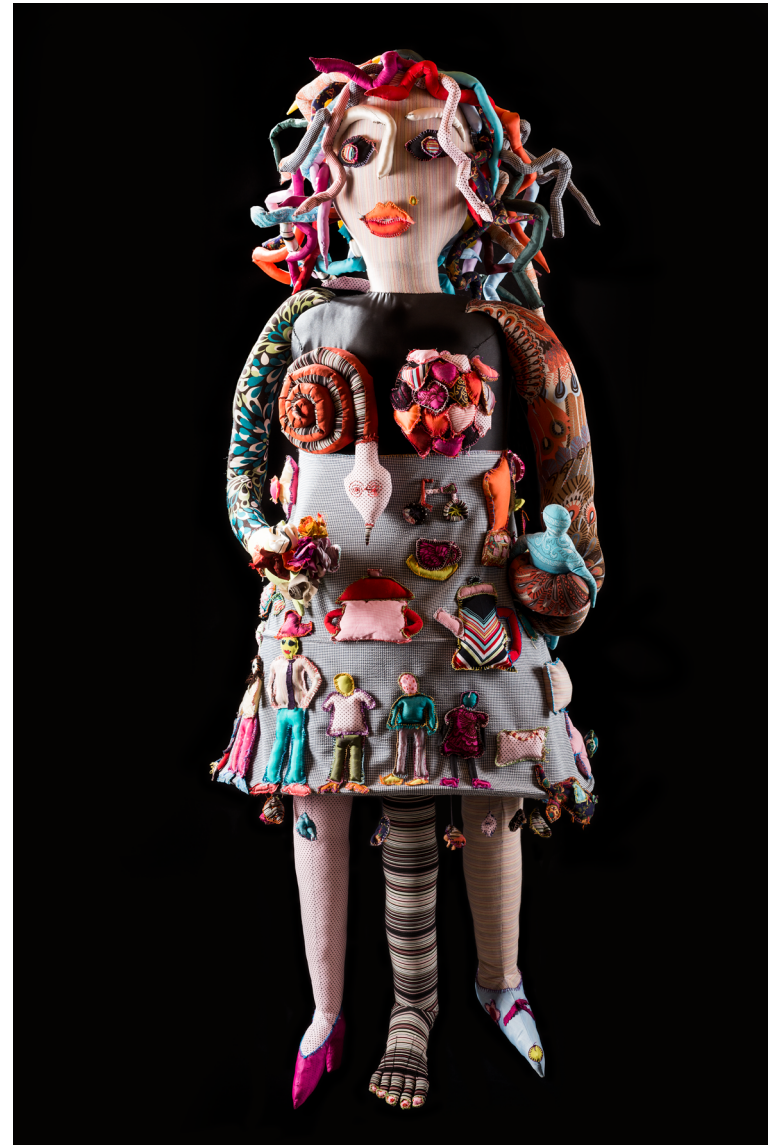
1. Nudibranquio (página anterior) Telas, hilos Dimensiones variables 2022 - 2023