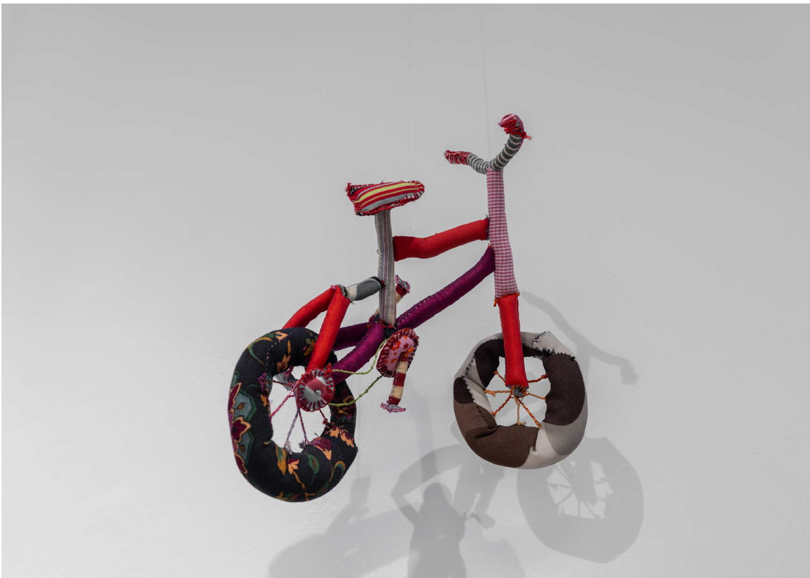
11. Bicicleta Telas, hilos 20 x 23,5 cm 2011 - 2012