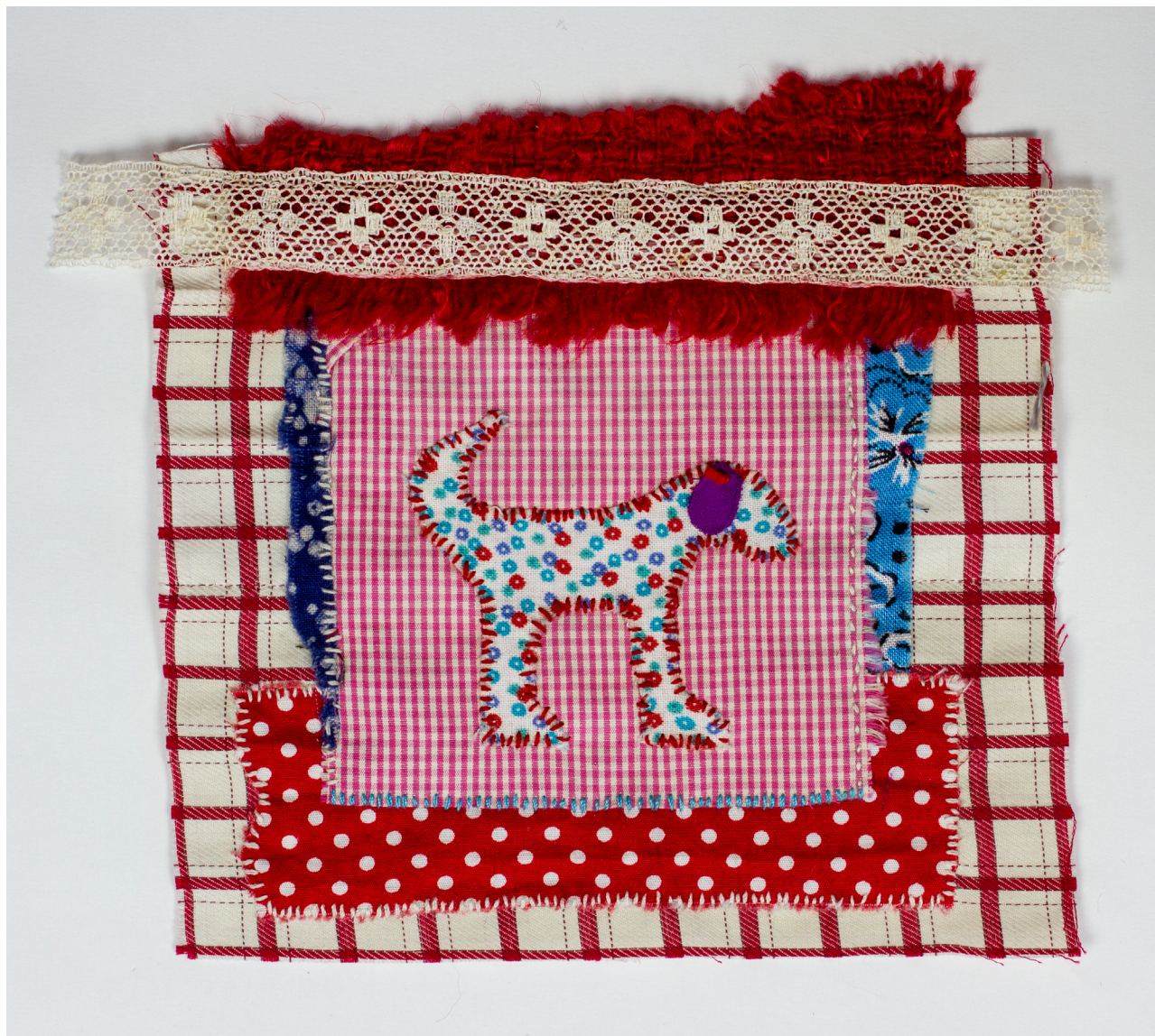
8. Perrito Telas, hilos Dimensiones variables 2020