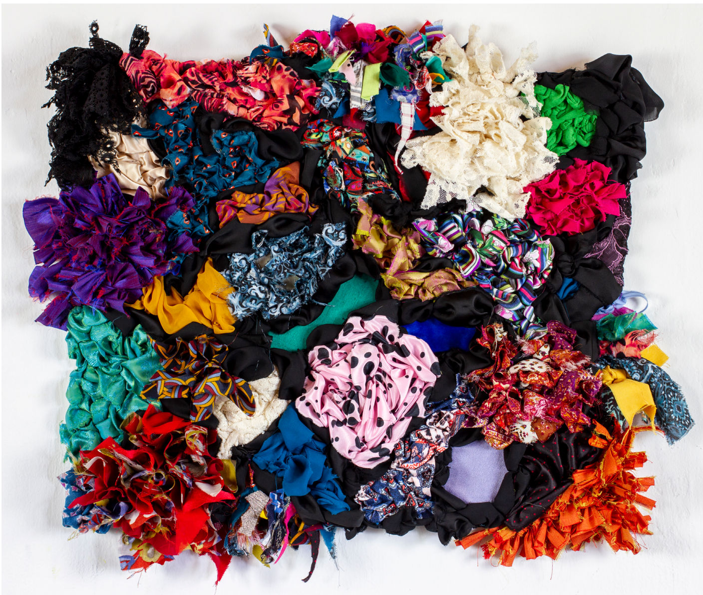
9. Dose 2 Telas, hilos Dimensiones variables 2022 - 2023