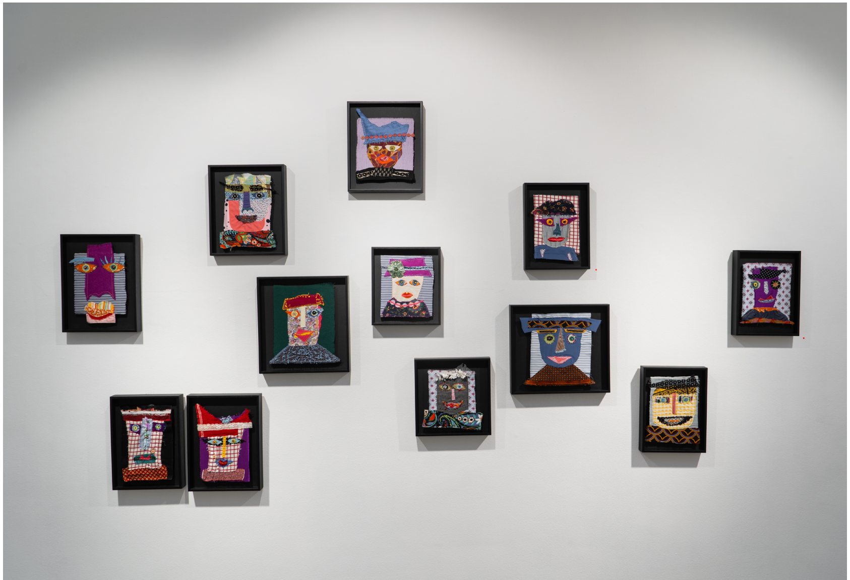
3. Personaje #1 - #12 (de izquierda a derecha) Telas, hilos Dimensiones variables 2022 - 2023