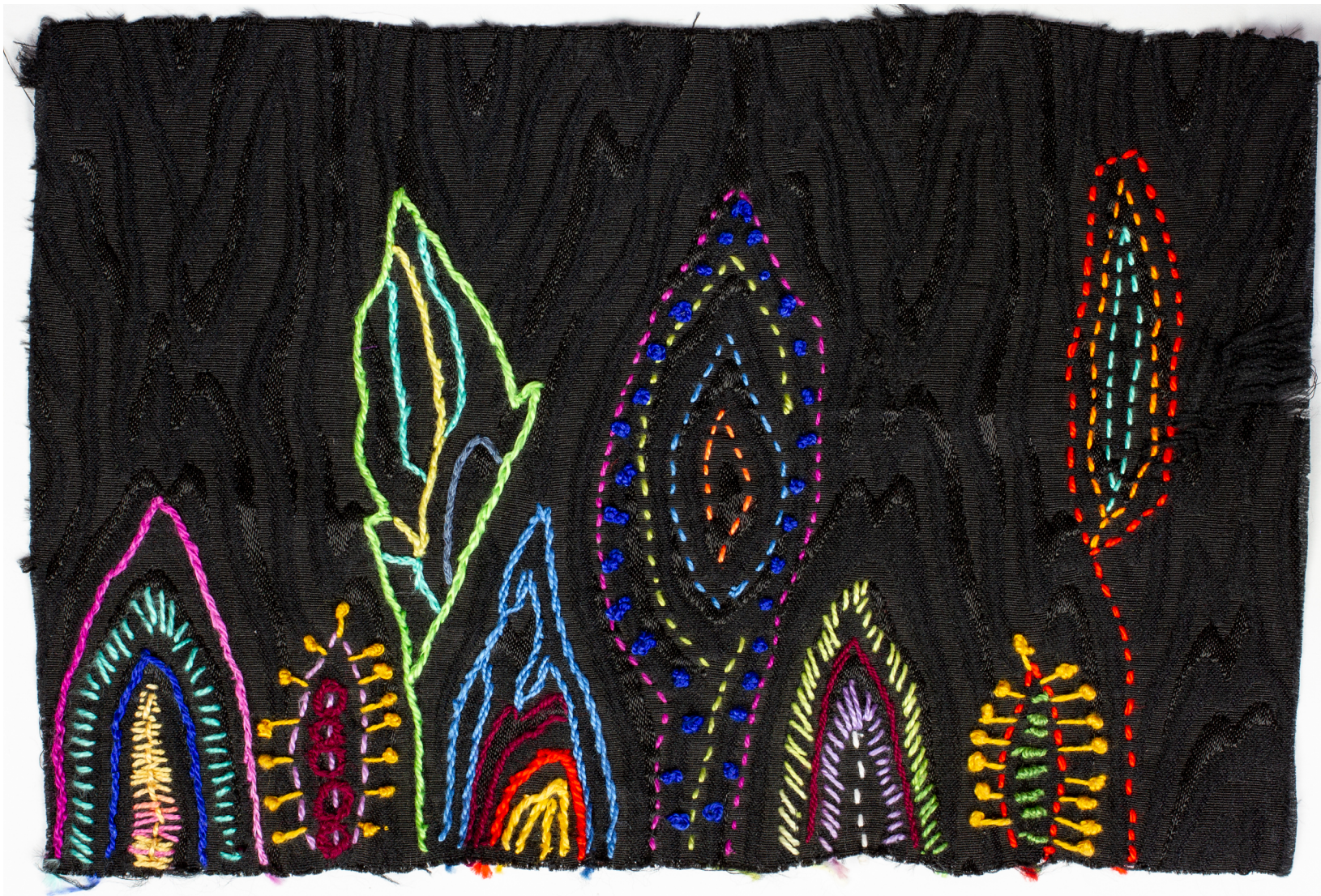
11. Naturaleza Telas, hilos, caja Dimensiones variables 2020