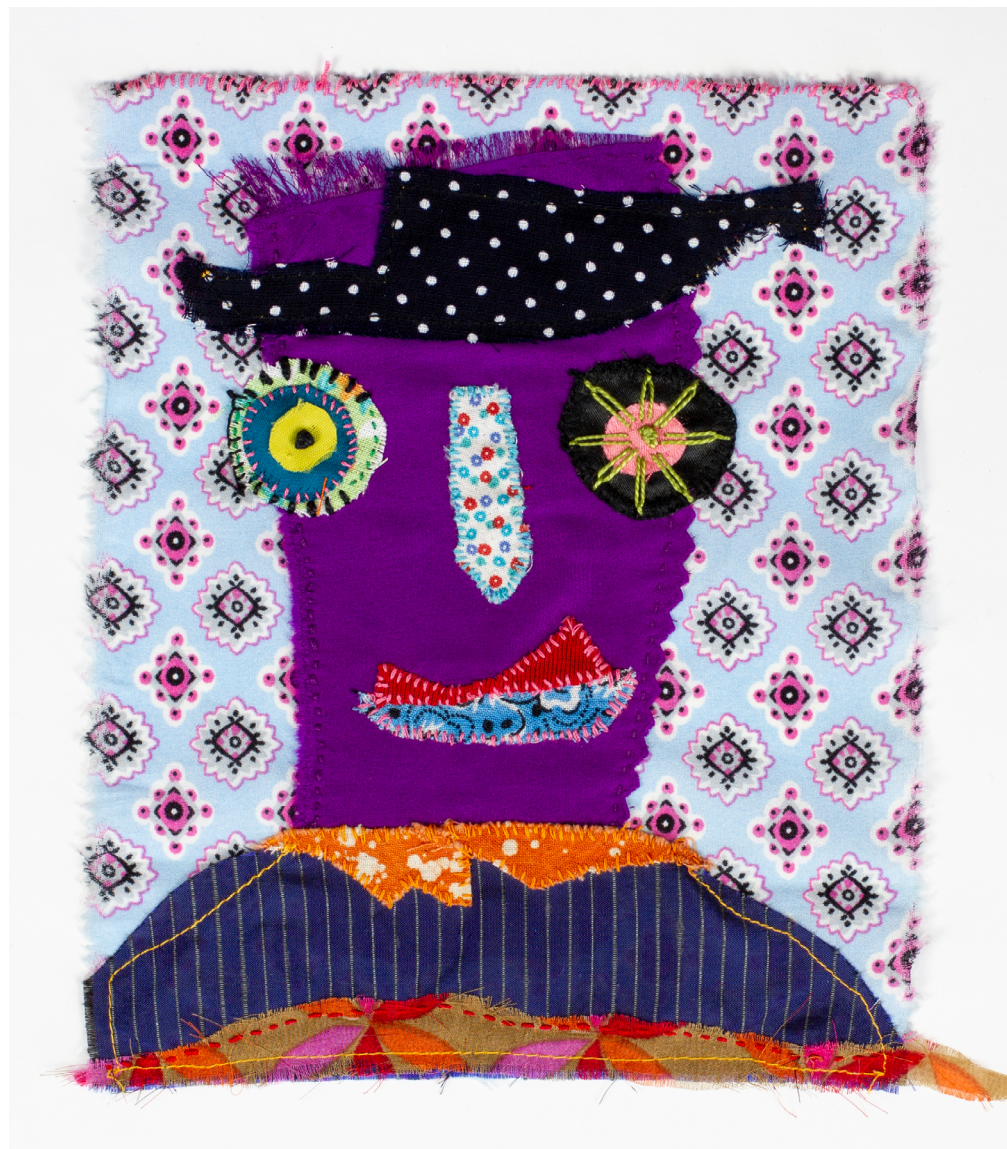
3. Personaje #2 Telas, hilos Dimensiones variables 2022 - 2023