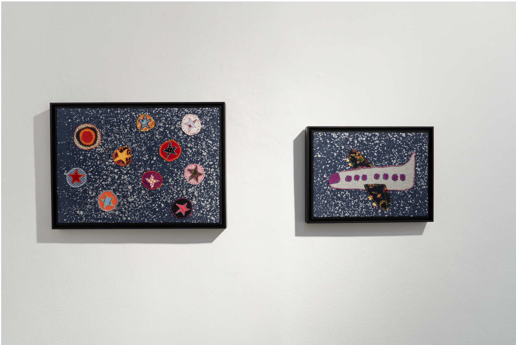
8. (de izquierda a derecha) Cielo Estrellado: 2020/2023 Vuelo Nocturno: 2020 Telas, hilos Dimensiones variables