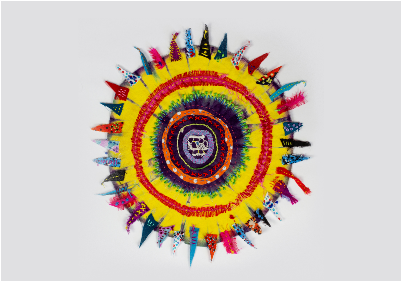
2. Sol Telas, hilos 17 cm de diámetro 2020 - 2021