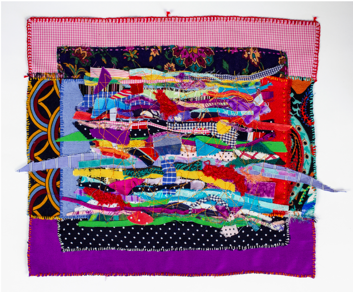
10. Paisaje íntimo 3 Telas, hilos Dimensiones variables 2019 - 2023