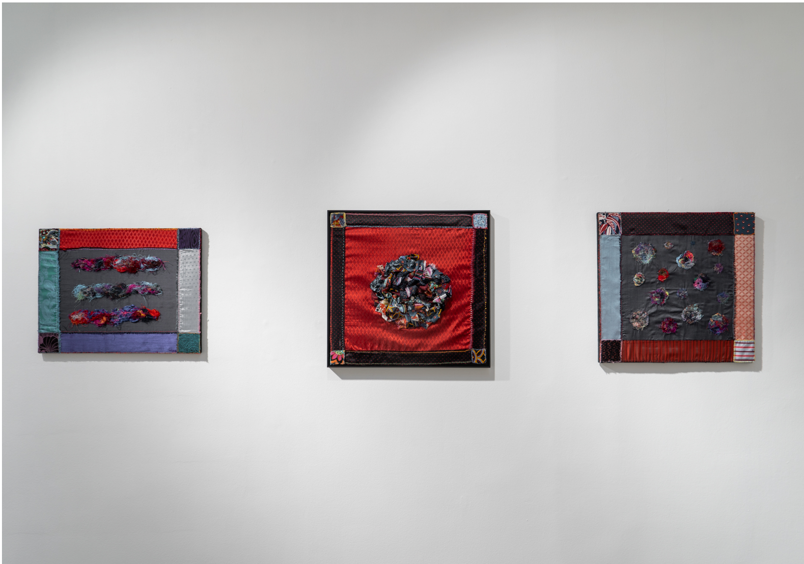
4. (de izquierda a derecha) Marañas 1: 2021 Nudo: 2023 Marañas 2: 2021 Telas, hilos Dimensiones variables