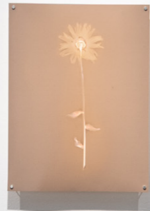
Margarita Lumen sobre papel plata gelatina, rc 30 x 40 cm 2026