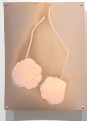
Stephania Erecta Lumen sobre papel plata gelatina, rc 30 x 40 cm 2026