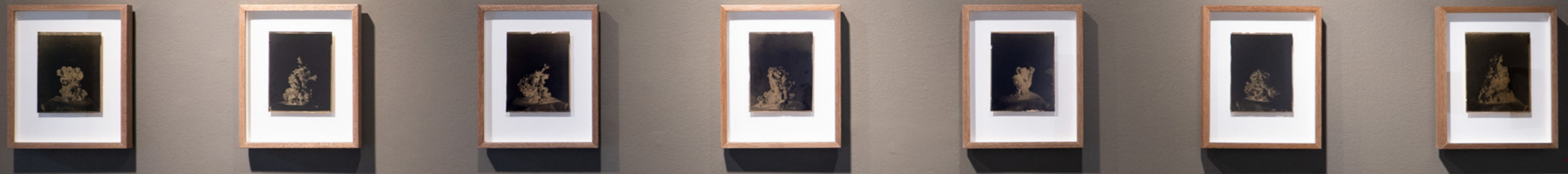
Serie Coral Película Ortho Litho Film, placa 4 x 5" con pan de oro 10 x 12,5 cm c/u 2026