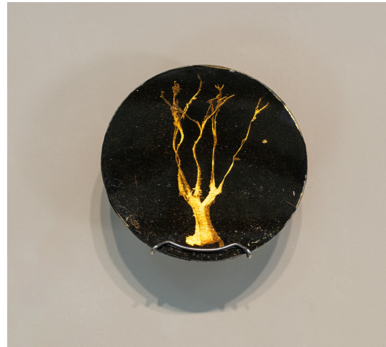
Serie Memento Mori Transferencia Xerox sobre vidrio con pan de oro Ø15cm 2018-2026