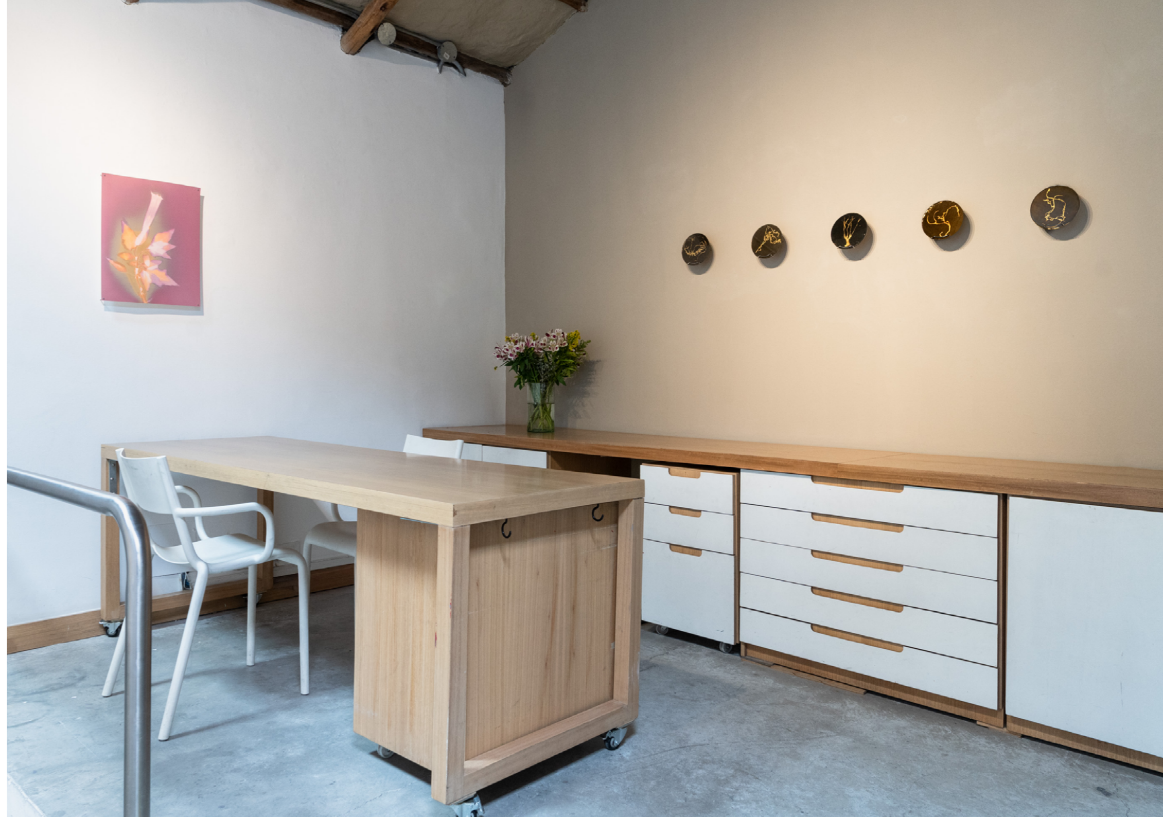
Floripondio Lumen sobre papel plata gelatina, fb 40 x 50 cm 2026