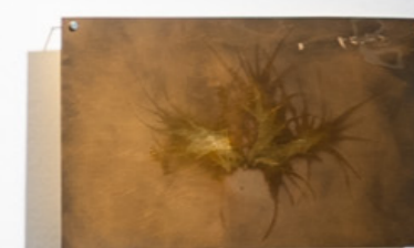
Rama II Lumen sobre Ortho Litho Film con pan de oro 18 x 28 cm 2026