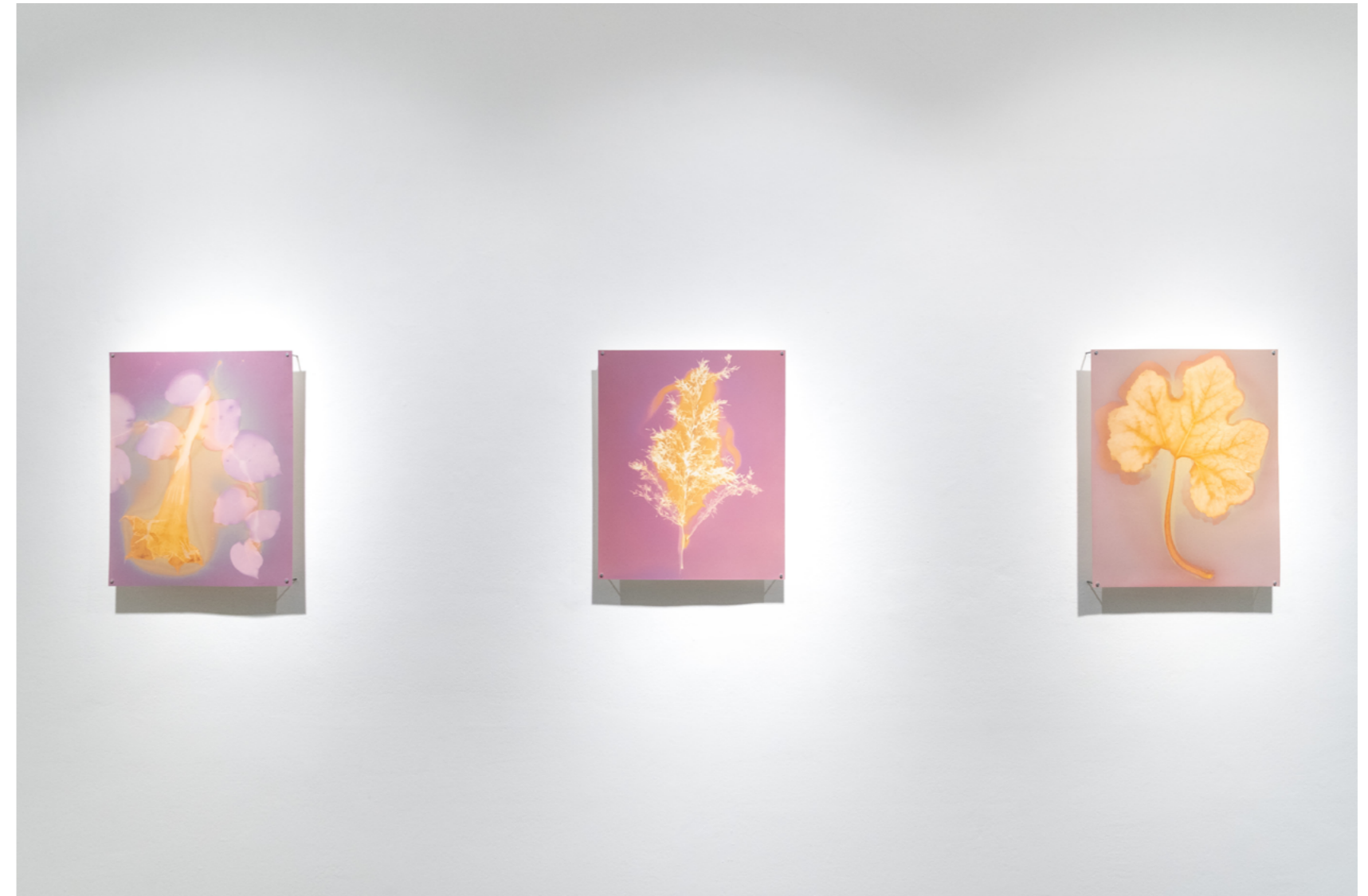
Floripondio y granadilla Lumen sobre papel plata gelatina, fb 40 x 50 cm 2026