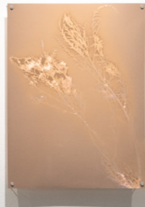
Ruda Lumen sobre papel plata gelatina, rc 30 x 40 cm 2026