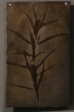
Salvia Lumen sobre Ortho Litho Film con pan de oro 17 x 28 cm 2026