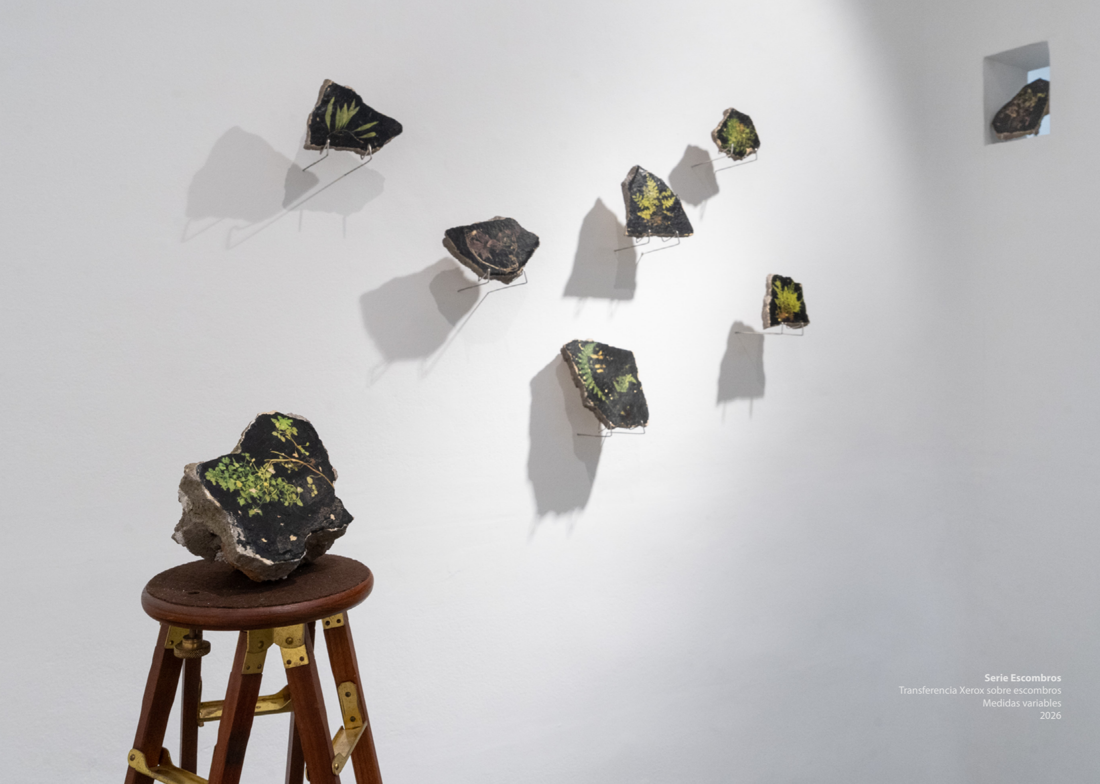
Serie Escombros Transferencia Xerox sobre escombros Medidas variables 2026