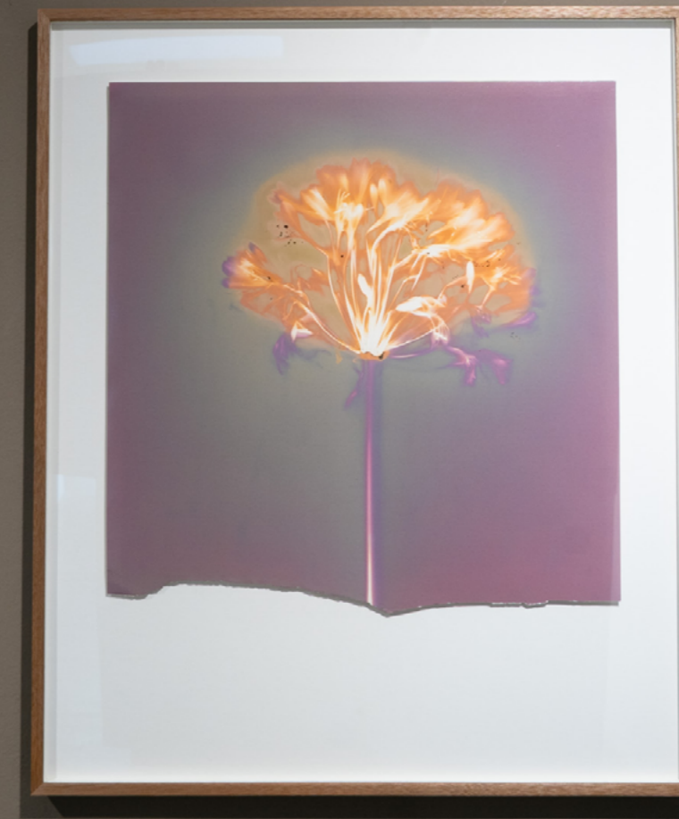
Agapanto II Lumen sobre papel plata gelatina, fb 40 x 40 cm 2026