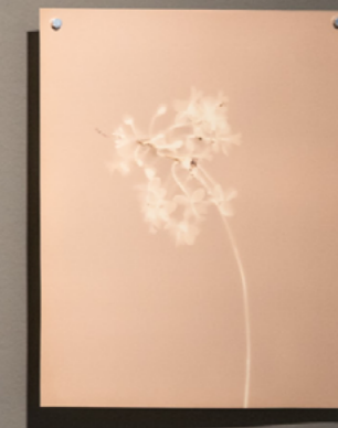
Maiwa Lumen sobre papel plata gelatina, fb 20 x 25 cm 2026