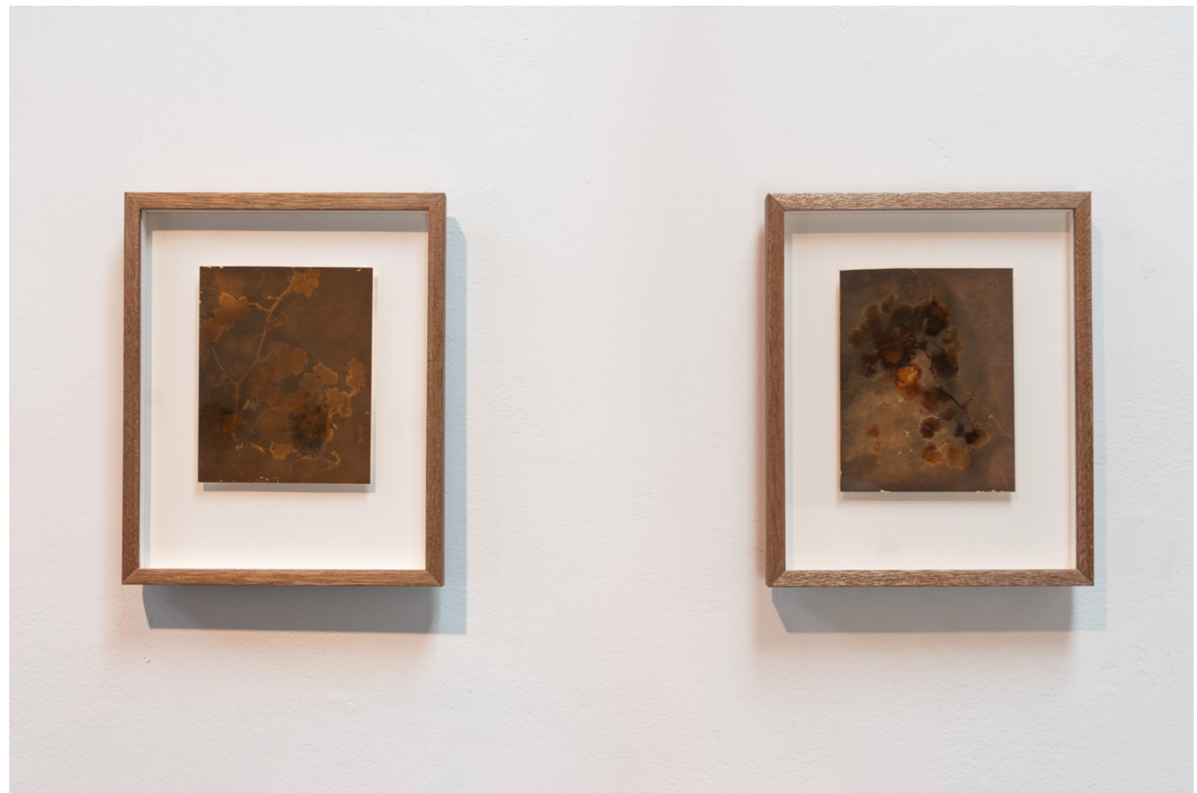
Enredadera I Película Ortho Litho Film, placa 4 x 5" con pan de oro 10 x 12,5 cm c/u 2026