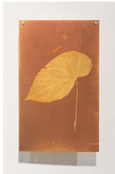
Begonia Lumen sobre Ortho Litho Film con pan de oro 17 x 28 cm 2026